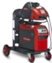
TransSteel 4000 Pulse