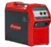
TransSteel 5000 Pulse